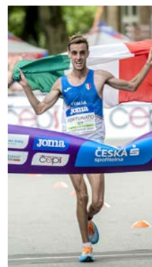
FORTUNATO (1° - 20 km. - 2023)