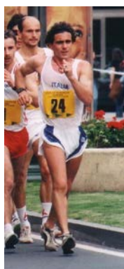
PERRICELLI (3° - 50 km. - 1998)