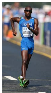
NKOULOUKIDI (3° - 20 km. - 2009)