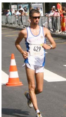
RUBINO (1° - 20 km. - 2009)