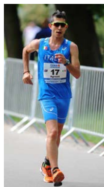
AGRUSTI (3° - 50 km. - 2021)