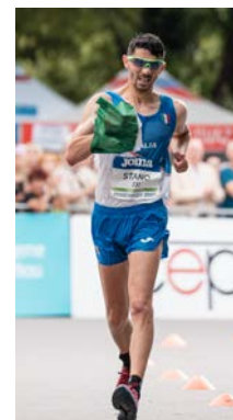
STANO (3° - 20 km. - 2023)