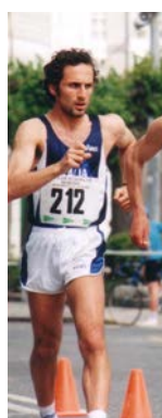
DI MEZZA (2° - 50 km. - 1996)