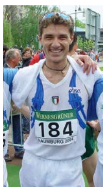
GANDELLINI (2° - 20 km. - 2003)